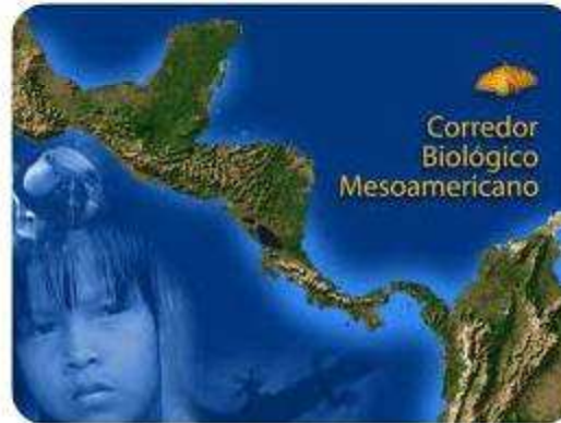
Preservación de Ecosistemas