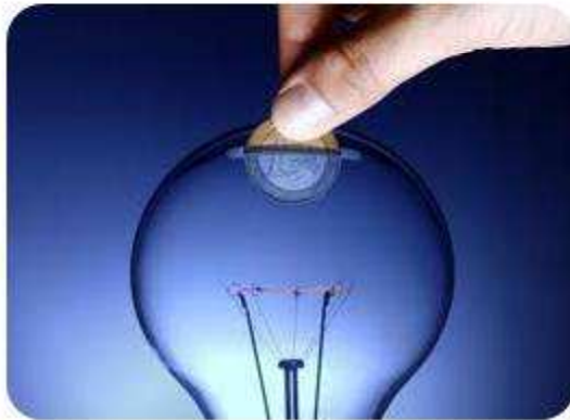
Control de Energía