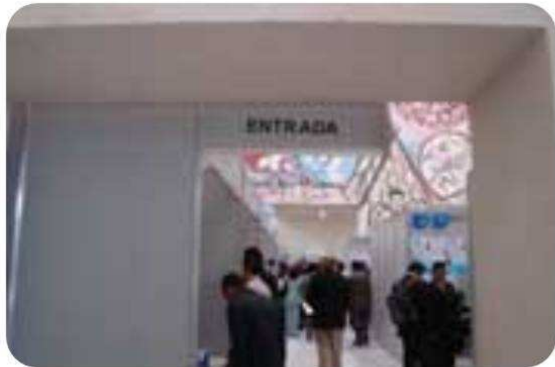
Salón Mural I y II