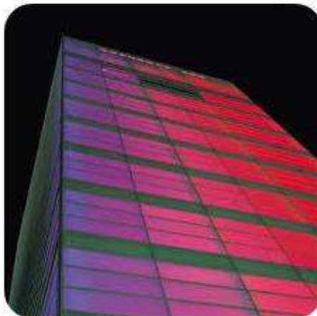
Iluminación de LED'S