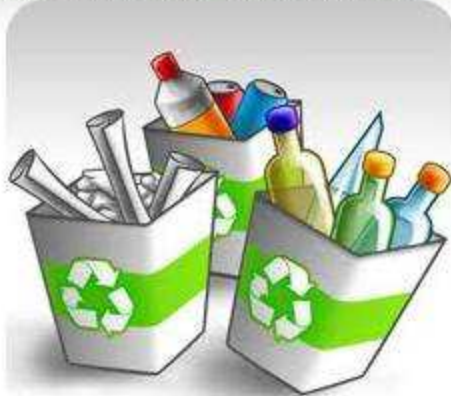
Recycle, Reúse y Reduce